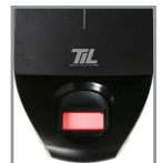
Disponible avec capteur biométrique